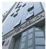
La Procura di Napoli

Colpito da una trave, operaio in fin di vita. Si tratta di un incidente avvenuto sabato scorso, in circostanze ancora poco chiare. A rimanere gravemente ferito è un uomo di 58 anni, che risulta anche caposquadra di Napoli Servizi, la municipalizzata del Comune di Napoli, che si occupa proprio degli interventi in materia di tutela dell'arredo e del patrimonio comunale. E sono proprio i vertici di Napoli Servizi a chiarire che