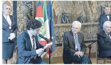
L'incontro dei ragazzi di Nisida al Quirinale con Mattarella