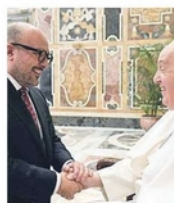
Sangiuliano dal Santo Padre

Un incontro nella sala Clementina. Un'udienza con i docenti e gli alunni della Scuola Vaticana. A tutti, studenti e professori, Bergoglio rivolge un appello: «Difendetevi da ciò che di tossico, malsano e violento si può annidare nel mondo dei social e delle conoscenze tecnologiche». All'udienza anche il ministro della Cultura che aveva incontrato Papa Francesco al Colosseo all'inizio del suo mandato. «Ho apprezzato il di-