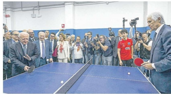
Collana, la nuova palestra: De Luca gioca a Ping-pong con il presidente del Coni, Giovanni Malagò